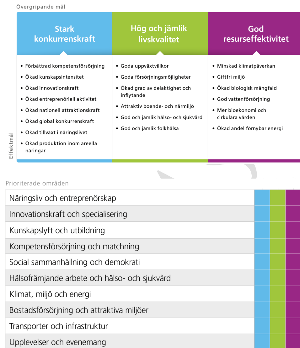
Figur 1: Översiktsbild – kopplingen mellan vision, övergripande mål, effektmål och prioriterade områden.